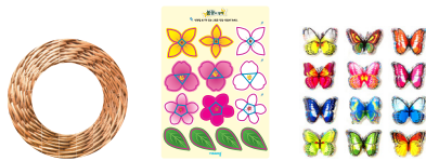
· 리스 · 봄꽃 종이 · 나비 스티커