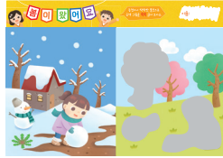
· '겨울과 봄' 비밀 그림